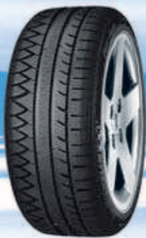
Pilot Alpin PA3