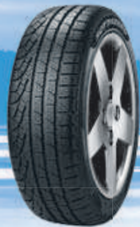
Winter Sottozero II