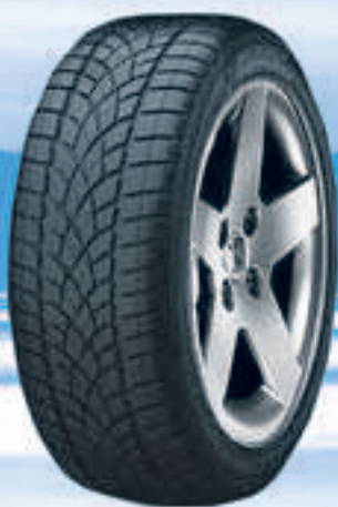
SP Winter Sport 3D