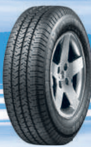
Agilis 51 Snow Ice