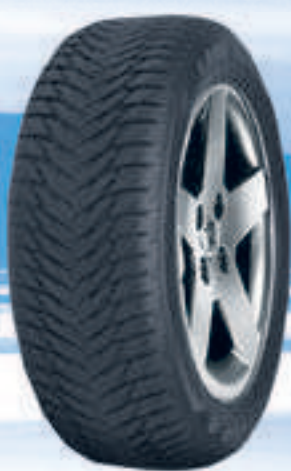
UltraGrip 8 MS