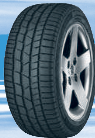
ContiWinterContact TS 830 P