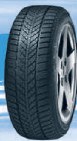
Kristall Control HP